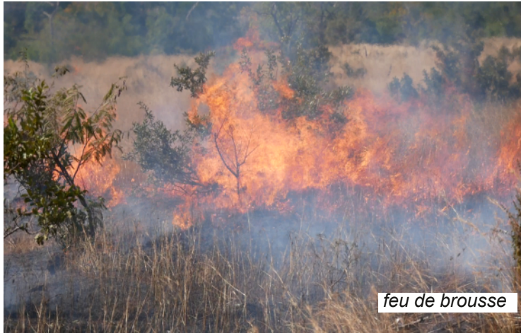
feu de brousse

Plusieurs choses peuvent être à l'origine de la perturbation de la biodiversité. L'Homme est aujourd'hui, l'être vivant le plus impactant sur le changement climatique. A Dindéfelo, deux pratiques qui affectent la biodiversité ont attiré notre attention. Nous nous intéresserons ici aux actions de l'homme qui sont aussi à l'origine du changement climatique, de la perturbation de la biodiversité.