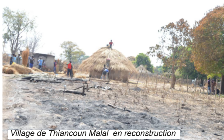
Village de Thiancoun Malal en reconstruction

A la suite de cet événement malheureux qui s'est soldé par d'importants dégâts matériels, nous avons désormais décidé faire des pare-feu chaque année.