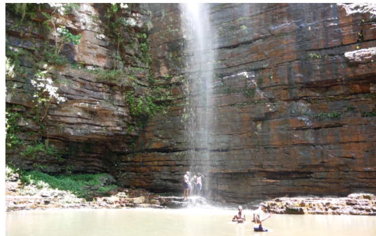
Cascade de Dindéfélo

Notre commune de Dindéfélo regorge d'espèces animales et végétales. Beaucoup d'arbres fruitiers comme le manguier, le bananier, le néré et le baobab et son fruit, le pain de singe. On peut également trouver du tamarin, de la fleur de bissap ou du kinkéliba avec lesquels on peut produire du jus. On trouve aussi des chèvres, des moutons, des vaches, des poules et d'autres animaux domestiques mais aussi des phacochères, des hippopotames ou des chimpanzés, une espèce protégée.