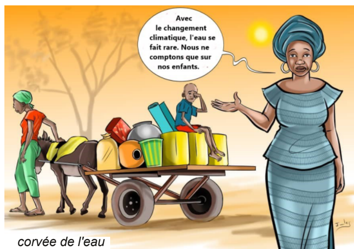
corvée de l'eau

La chaleur ressentie ces dernières années n'épargne personne. Elle perturbe le plus souvent les activités de l'élève.