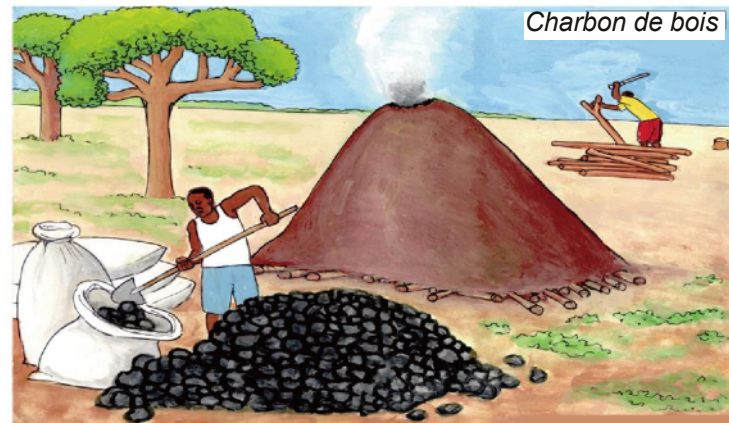
Charbon de bois

A côté des feux de brousse, l'homme (le charbonnier, l'agriculteur, l'apiculteur) armé de hache, de coupe-coupe ou de tronçonneuse abat certains arbres. Même certaines espèces protégées sont coupées de façon frauduleuse pour fabriquer des lits, des armoires ou les toits des maisons.