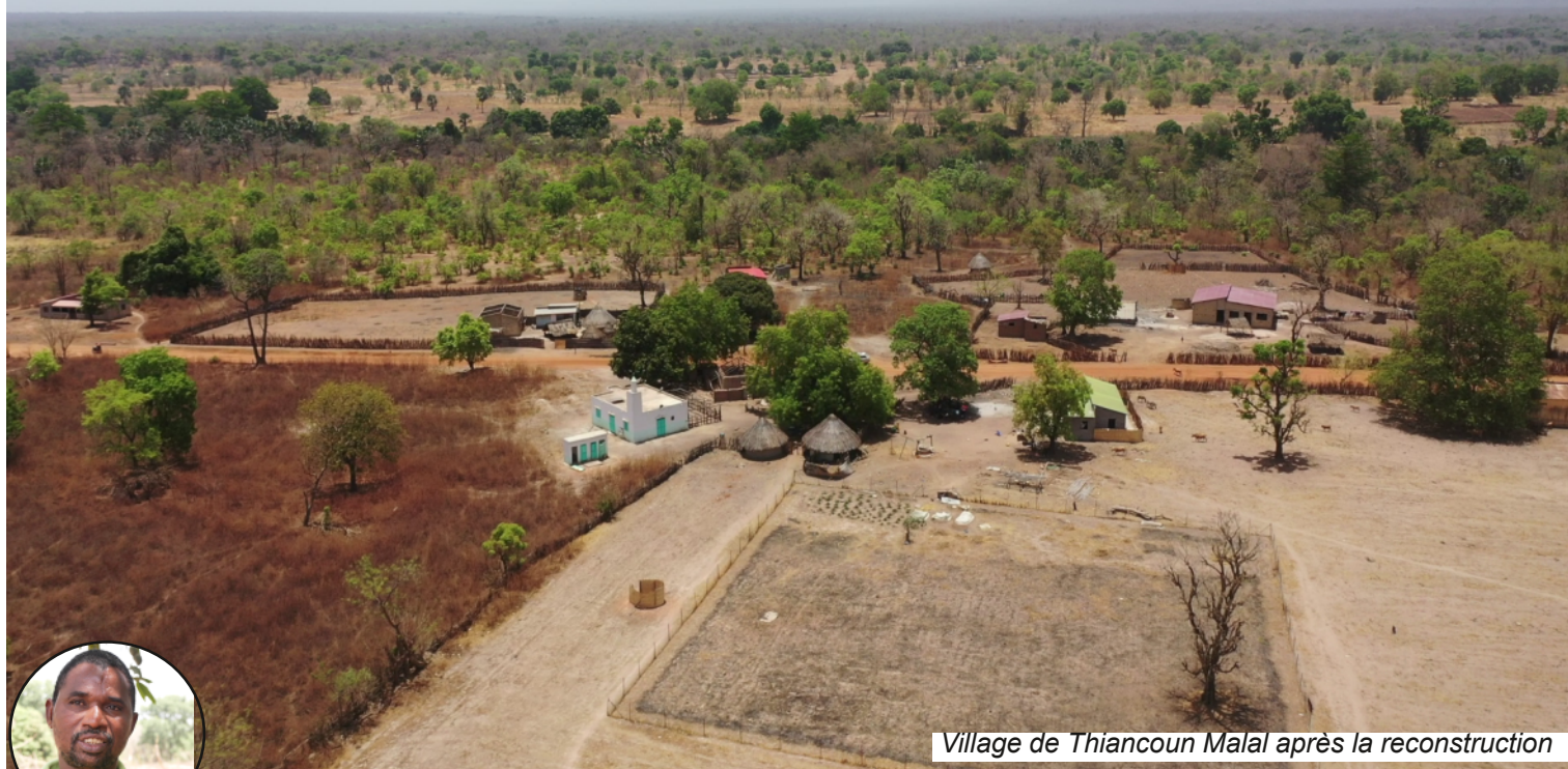
Village de Thiancoun Malal après la reconstruction