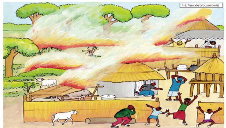
feu de brousse

Les feux de brousse entraînent aussi une production d'importantes quantités de fumées qui montent dans le ciel. La disparition de la flore occasionne une chaleur excessive et la sécheresse. La disparition de la faune entraîne une baisse des recettes touristiques.