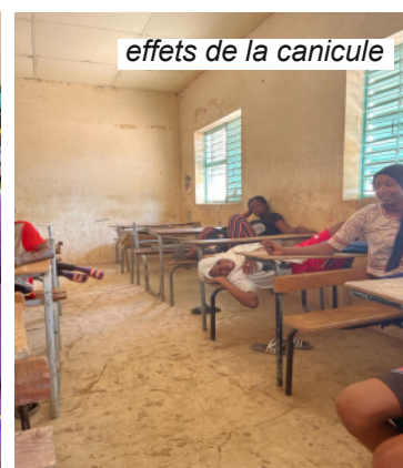
effets de la canicule