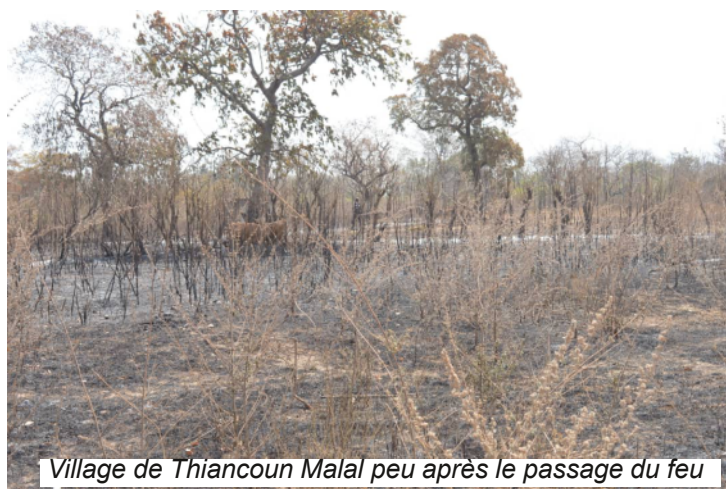
Village de Thiancoun Malal peu après le passage du feu

dans le village les jours suivants. On accusait souvent les enfants comme auteurs de ces incendies.