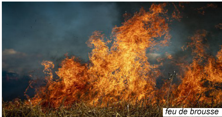
feu de brousse

Les feux de brousse sont souvent causés par des chasseurs, des agriculteurs, des charbonniers, des récolteurs de miel, des fumeurs ou par des personnes mal intentionnées.