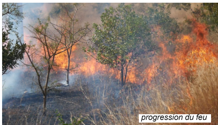
progression du feu

Avec nos voisins des villages environnants et les sapeurs-pompiers, nous avons participé à l'assaut contre le feu. Mais c'était trop tard, le mal était déjà fait.