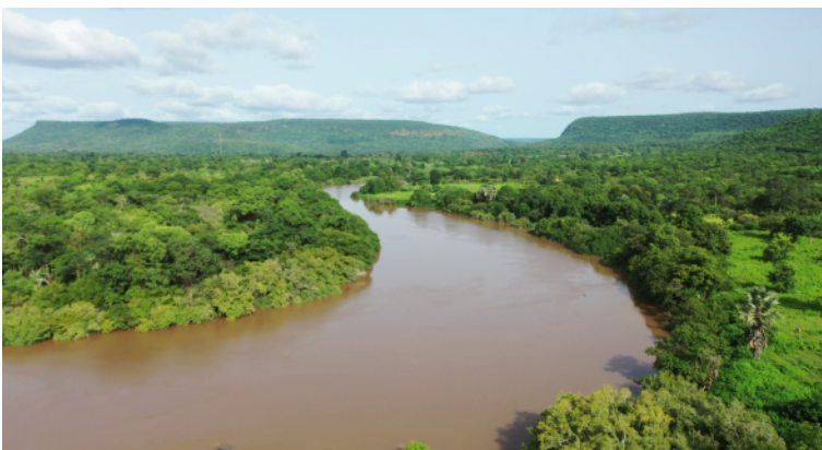
Fleuve Gambie à Thiabé Carré